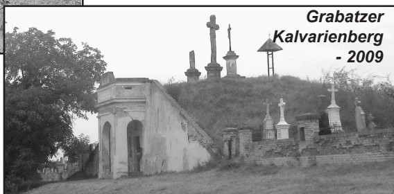
Grabatzer Kalvarienberg - 2009

pe Calea Torontalului, se află o movilă cu o înălțime de 8 metri și cu un diametru care nu trece de 50 de metri. Încă din anul 1837, în partea superioară a movilei a fost ridicată o cruce. După cum relatau autoritățile vremii, în Vinerea Mare, dimineața, la